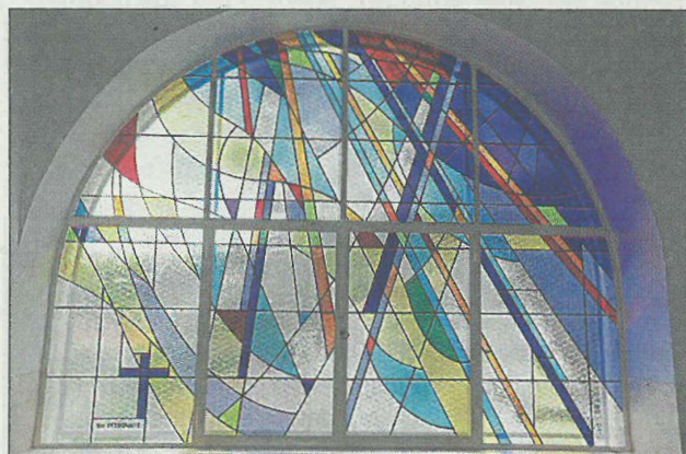
L'un des deux vitraux réalisé par Vitrail et décoration