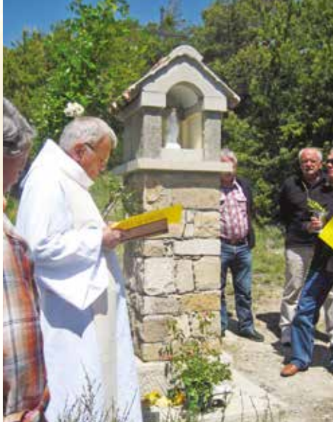
Oratoire Notre-Dame des Victoires à La Tour-sur-Tinée.