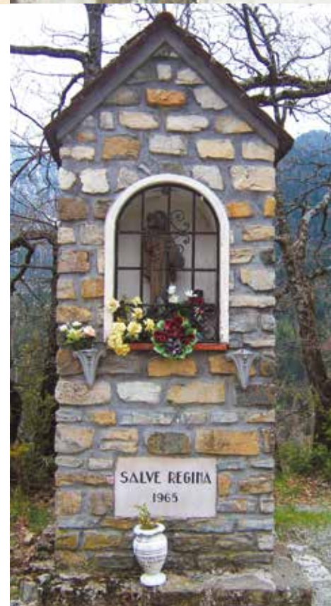
Oratoire Notre-Dame à Venanson.