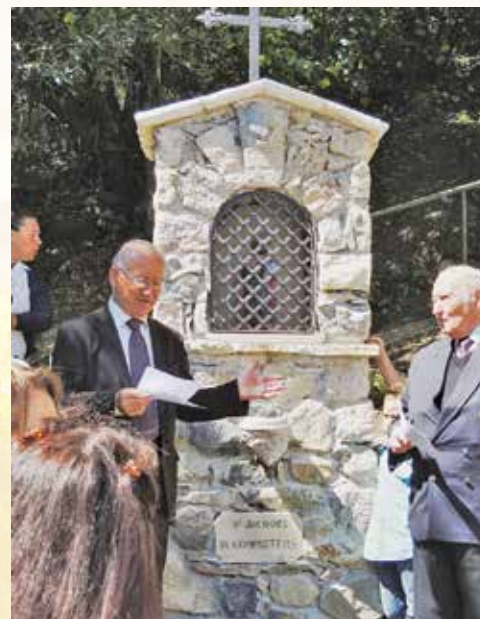
Oratoire Saint-Jacques de Compostelle à Tourrette-Levens.

du patrimoine rural. Souvent situés à des carrefours, sur les anciennes voies de circulation, ils guident le voyageur sur le chemin d'une chapelle, d'un ermitage ou d'un lieu de pèlerinage. Placés en évidence au passage d'un pont ou d'un col au bord d'un précipice, ils protègent le voyageur et le randonneur. Au-dessus d'une source ou d'un puits, ils sacralisent la source tout en indiquant le point de ravitaillement tant attendu. Certains furent construits en remplacement d'une ancienne chapelle trop vétuste pour pouvoir être restaurée, et demeurent ainsi le dernier témoin d'un village disparu.