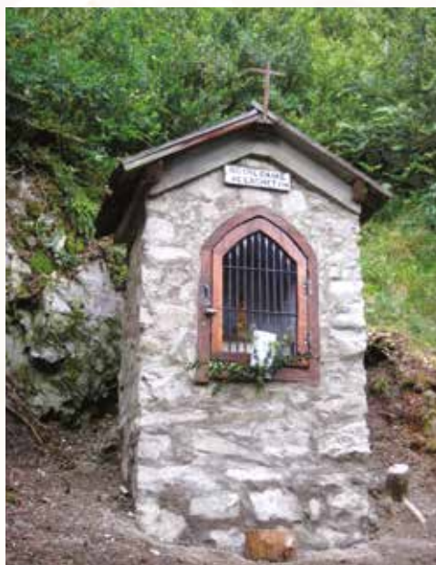
Oratoire Notre-Dame de Laghet à Saint-Étienne-de-Tinée.