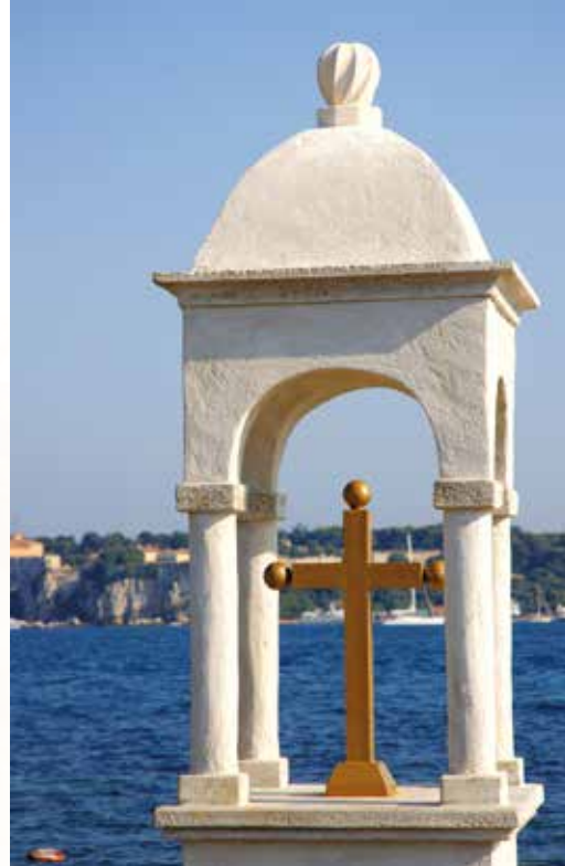
Oratoire de la Croisette à Cannes.

Sauvegarde et transmission sont les leitmotifs de cette association nationale qui œuvre depuis les années 30 pour la conservation des oratoires. Inventaires, publications, conférences, restaurations et constructions animent ses membres.