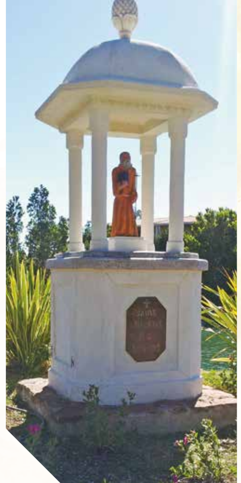
Oratoire Saint-Vincent de Lérins à Mandelieu-la-Napoule.

L e rôle de l'association Connaissance et sauvegarde des oratoires est multiple. Le premier étant la restauration d'oratoires. L'association alerte les maires ou les particuliers propriétaires d'oratoires pour les inciter à les réparer. Malgré ses modestes moyens, elle offre souvent la statue ou la croix, parfois les deux, ce qui dégage les mairies du côté religieux. Bien souvent, ses bénévoles manient la truelle et l'association redonne naissance elle-même aux oratoires. Chaque année, plusieurs oratoires sont ainsi restaurés, principalement à la demande des municipalités, comme par exemple ce fut le cas à Saint-Etienne-de-Tinée. Les oratoires constituent un patrimoine vivant et actuel. Connaissance et sauve-