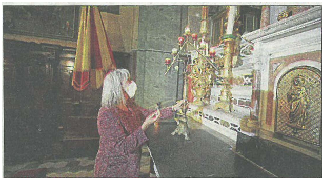
La basilique est prête à accueillir ses fidèles ce week-end à l'occasion des fêtes de la Pentecôte.

La petite équipe de Mentonnais – qui accueille toute l'année les visiteurs, croyants ou non – a continué sa mission, sous une autre forme. Tout en respectant les règles de sécurité et de protection, ils ont maintenu, par petites équipes, une prière pour la population et participé le dimanche à la messe célébrée avec