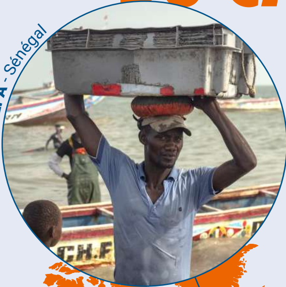
ADEPA - Sénégal