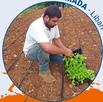
MADA - Liban