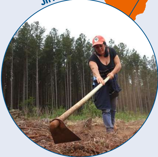
JnT - Brésil