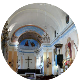
Castellar : 2 février