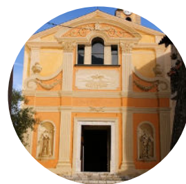
Gorbio 19 janvier

Tous nos horaires de messes : https://messes.info/