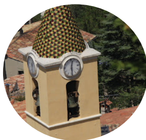
Sainte Agnès : 12 janvier